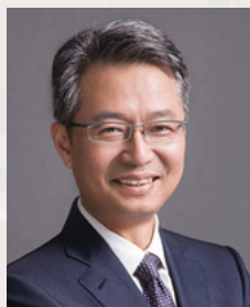
吴晓波 浙江大学社会科学学部主任 教育部长江学者特聘教授 浙江省特级专家